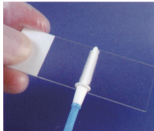
エンドサーベックスブラシ™